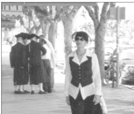
Хасиды в Нетании.