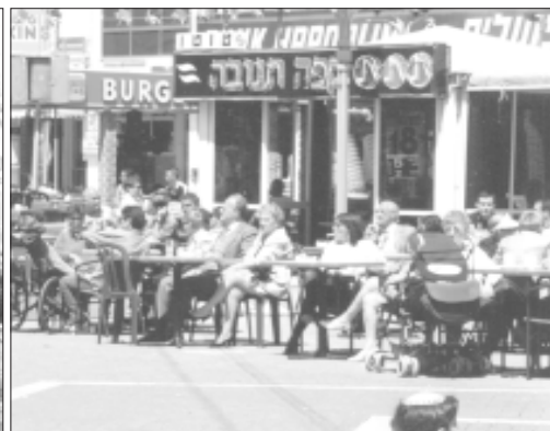
Кафе на улице Герцль в Нетании.