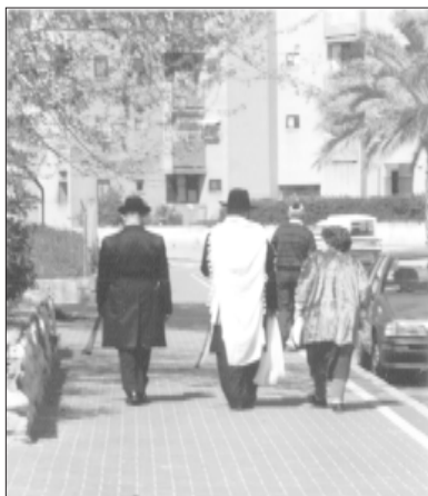
Умиротворение. Из синагоги по домам.