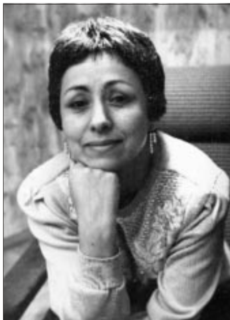
Перед выездом в Израиль.